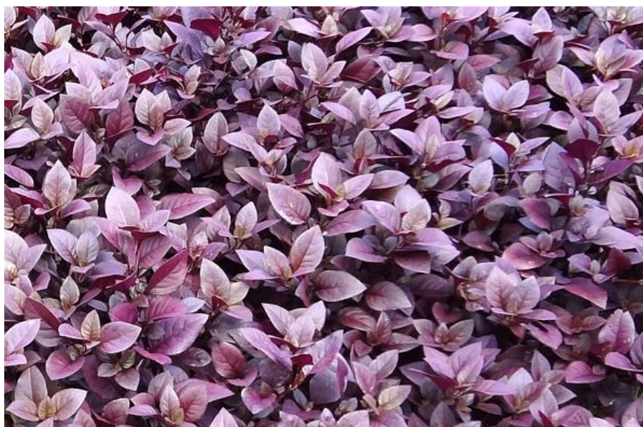
Imagem 7 – Mudas de Lutiela.

Serão plantadas mudas de Lutiela ( Alternanthera dentata ‘Little Ruby’) nos canteiros suspensos ao redor das árvores existentes.