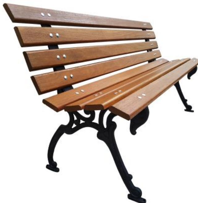
Imagem 3 – Banco tipo tamanduá.

Ainda, deverão ser instalados 02 (duas) mesas de jogos acompanhadas por dois bancos em arco cada uma (imagem 4), com diâmetro interno de 130 cm e altura de 43 cm e mesa com diâmetro de 80 cm, espessura de 8 cm e altura de 75 cm, confeccionadas em concreto aparente, polido, com acabamento em verniz, com tabuleiro de jogos embutido na parte superior.