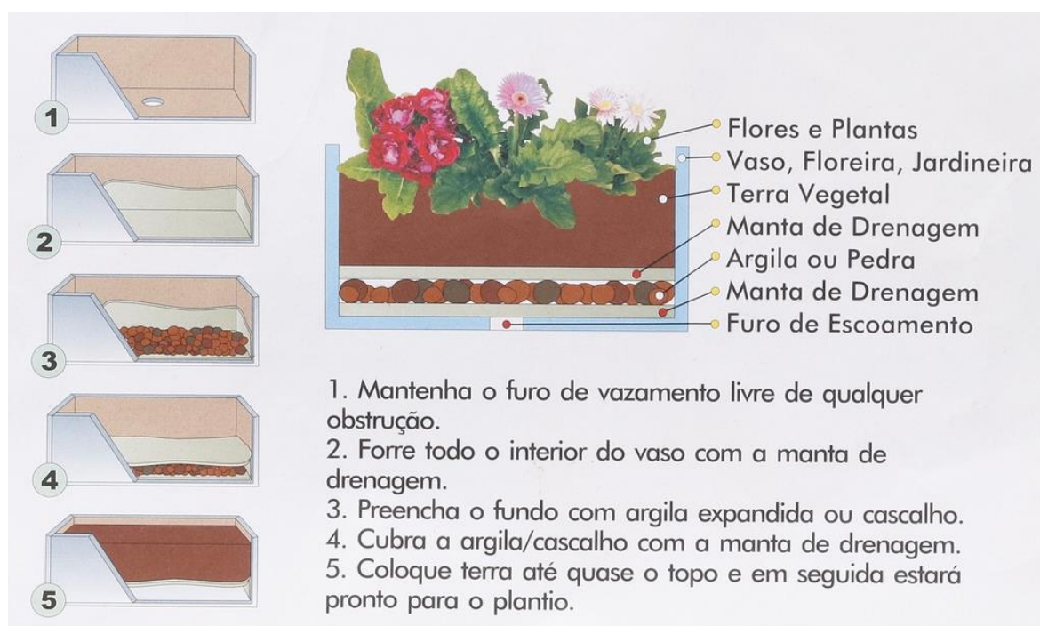
Imagem 2 – Esquema interno dos canteiros suspensos. Imagem meramente ilustrativa.

Os canteiros deverão ter um furo (cano de 25 mm) em sua base, para escoamento da água infiltrada. As camadas internas do canteiro deverão seguir o arranjo exemplificado na imagem 2.