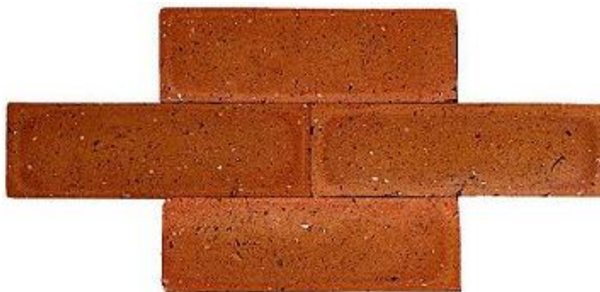
Imagem 1 - Revestimentos dos canteiros suspensos.

Serão executados 02 (dois) canteiros suspensos em alvenaria de blocos de concreto, no total de 50 cm de altura e espessura de 40 cm que servirão de banco. Os canteiros serão revestidos por cerâmica estilo tijolo aparente individual (imagem 1), rejuntadas em cor equivalente.