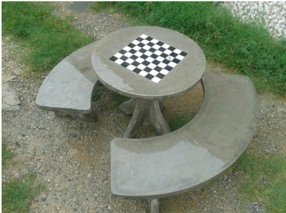
Imagem 4 - Conjunto de mesa e bancos para jogos em concreto.