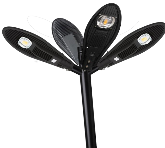
Imagem 5 – Poste com luminárias de LED em pétala.