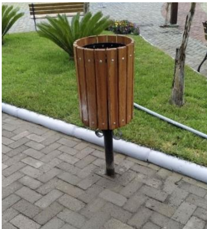
Imagem 6 – Cestos de lixo.