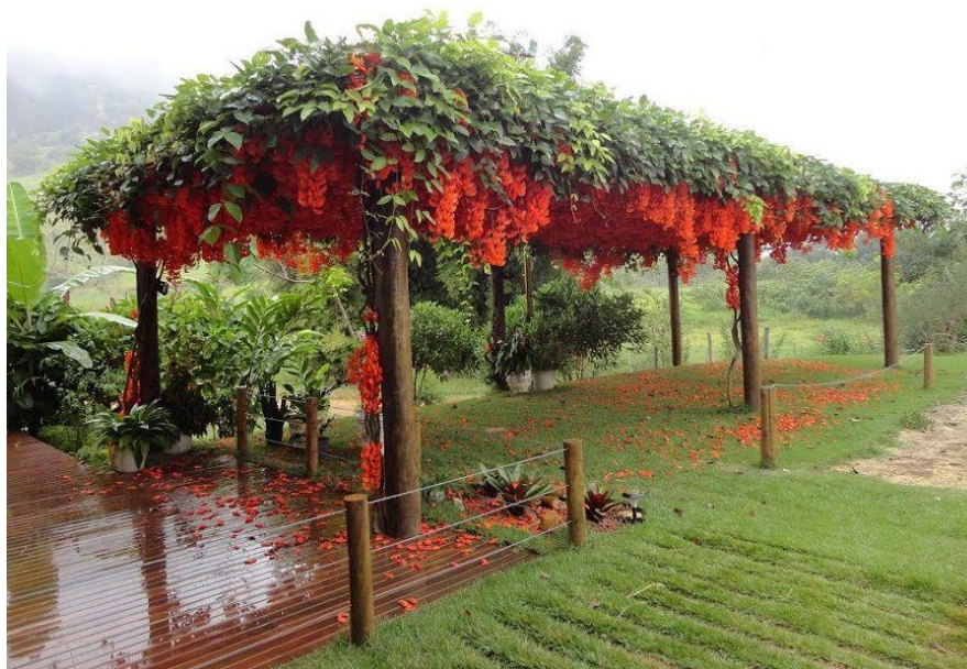
Imagem 8 – Jade vermelha.