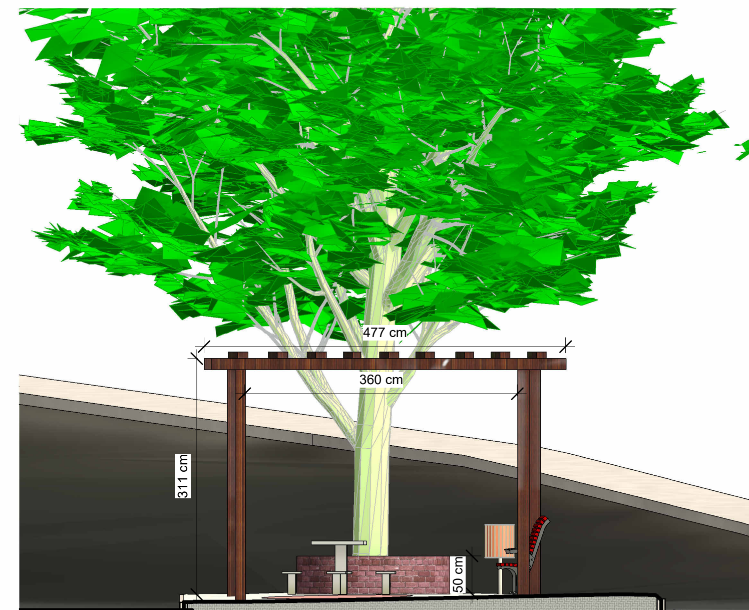
4 Corte 1 1 : 50