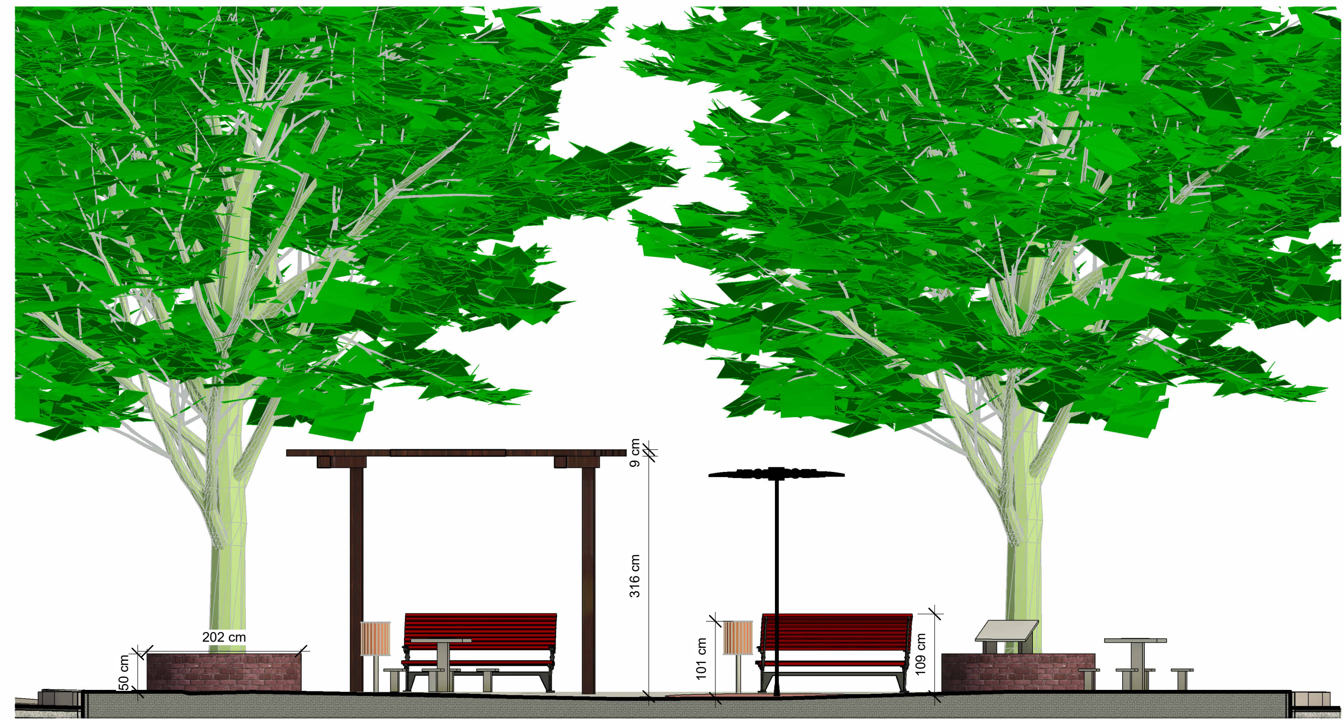
3 Corte 2 1 : 50