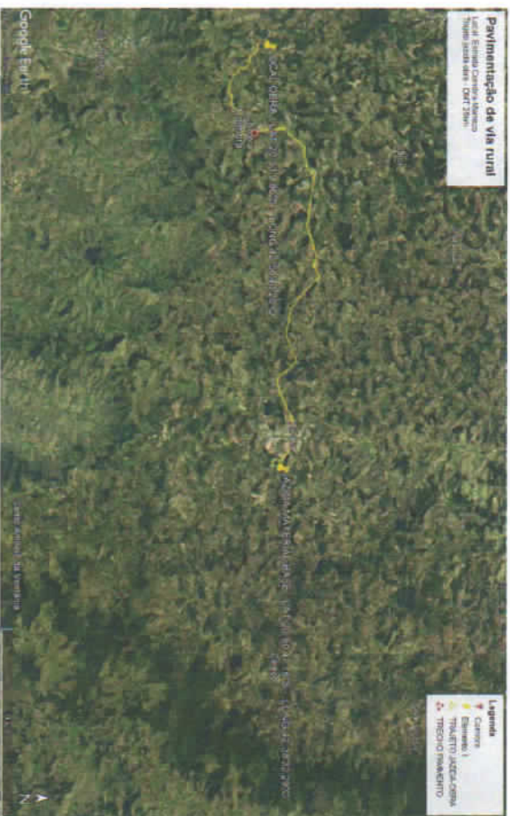
DMT - LOCALIZAÇÃO JAZIDA - ESC.: 1/250