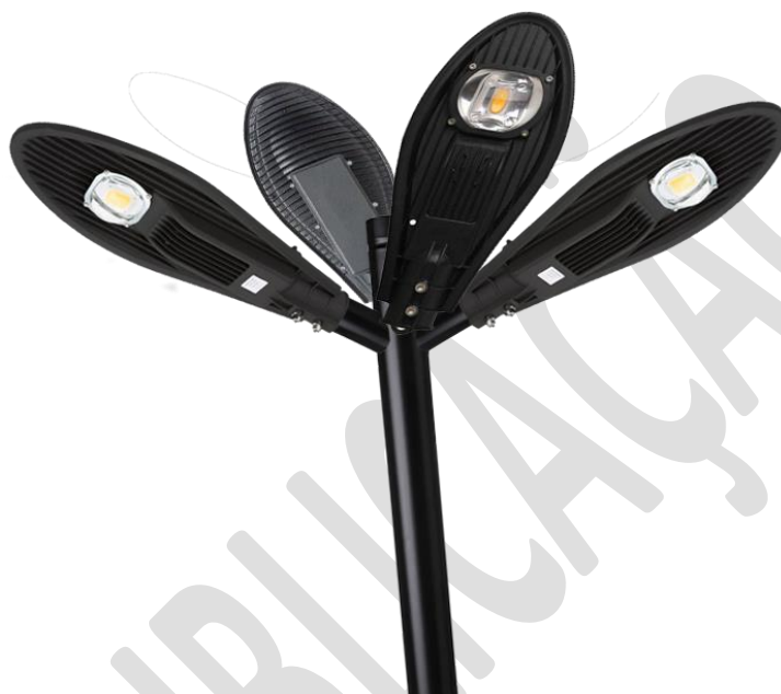
Imagem 4: Luminária em pétala.

A iluminação será feita com postes reto de 5,00 metros de comprimento e luminária em led do tipo pétala, cada uma com capacidade de 150 W. No topo será instalado relé fotoelétrico para acionamento automático da luminária ao entardecer. A instalação será feita de acordo com projeto arquitetônico fornecido.