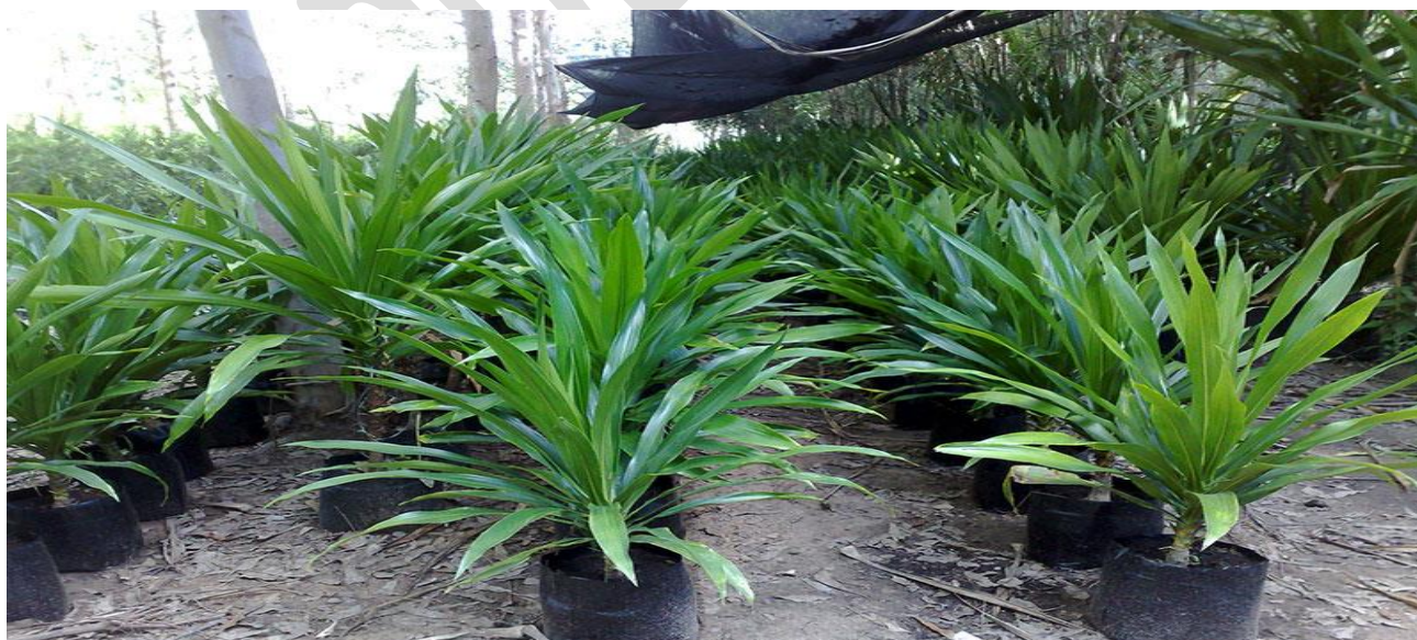
Figura 8: Planta "Dracena Verde".

Serão plantadas 16 mudas da planta denominada Dracena Verde (imagem 8) na área delimitada.