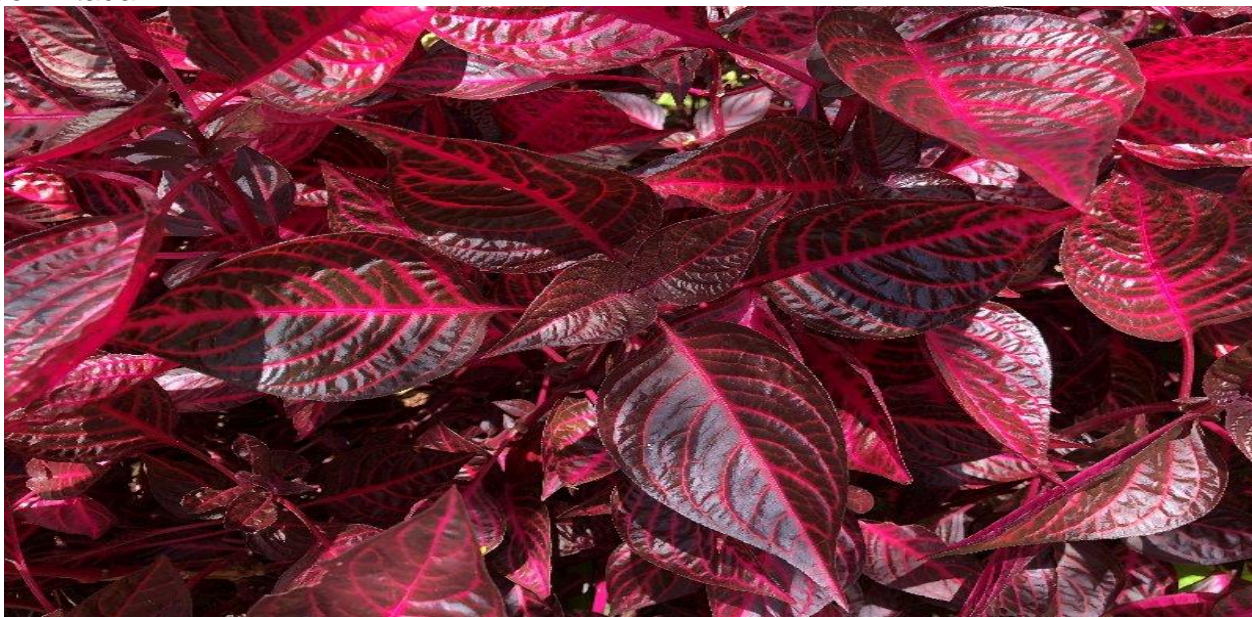
Imagem 7: Planta "Iresine"

Serão plantadas 147 mudas da planta denominada Iresine (imagem 7) na área delimitada.