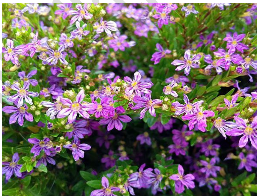
Imagem 6: Planta "Érica".

Serão plantadas 227 mudas da planta denominada Érica (imagem 6) na área delimitada.