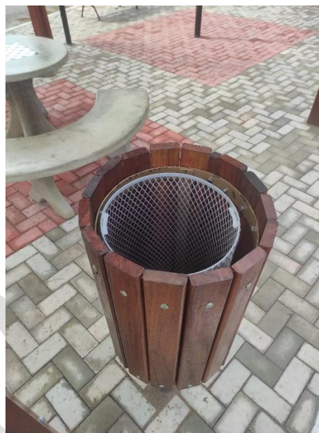
Imagem 3: Lixeira.