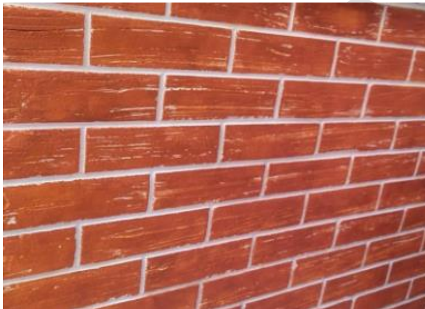
Imagem 2: Acabamento com efeito de tijolo à vista.

Os canteiros serão feitos em alvenaria de vedação com blocos de concreto com 14 cm de espessura, com cintas e pilares para amarração. Após o assentamento, será aplicado chapisco e argamassa com aditivo impermeabilizante nas faces internas e externas dos canteiros. O acabamento do canteiro será em tijolinho à vista feito manualmente na argamassa (imagem 2). Em sequencia será aplicado tinta acrílica, duas demãos, na cor Terra – Cota, Suvinil, equivalente ou superior.