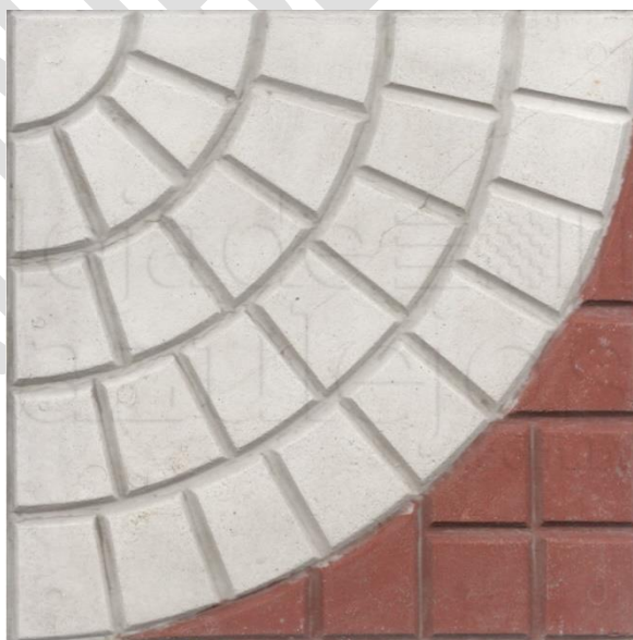
Imagem 1: Piso.

Serão assentados ladrilhos hidráulicos em concreto (imagem 1) na em duas cores, assentado com argamassa industrializada, perfazendo toda a área do piso demolido anteriormente, perfazendo uma área de 319,00 m 2 .