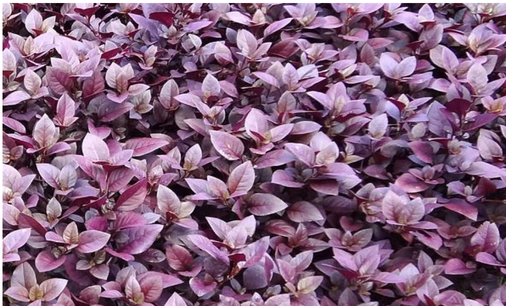
Imagem 5: Planta "Lutiela".