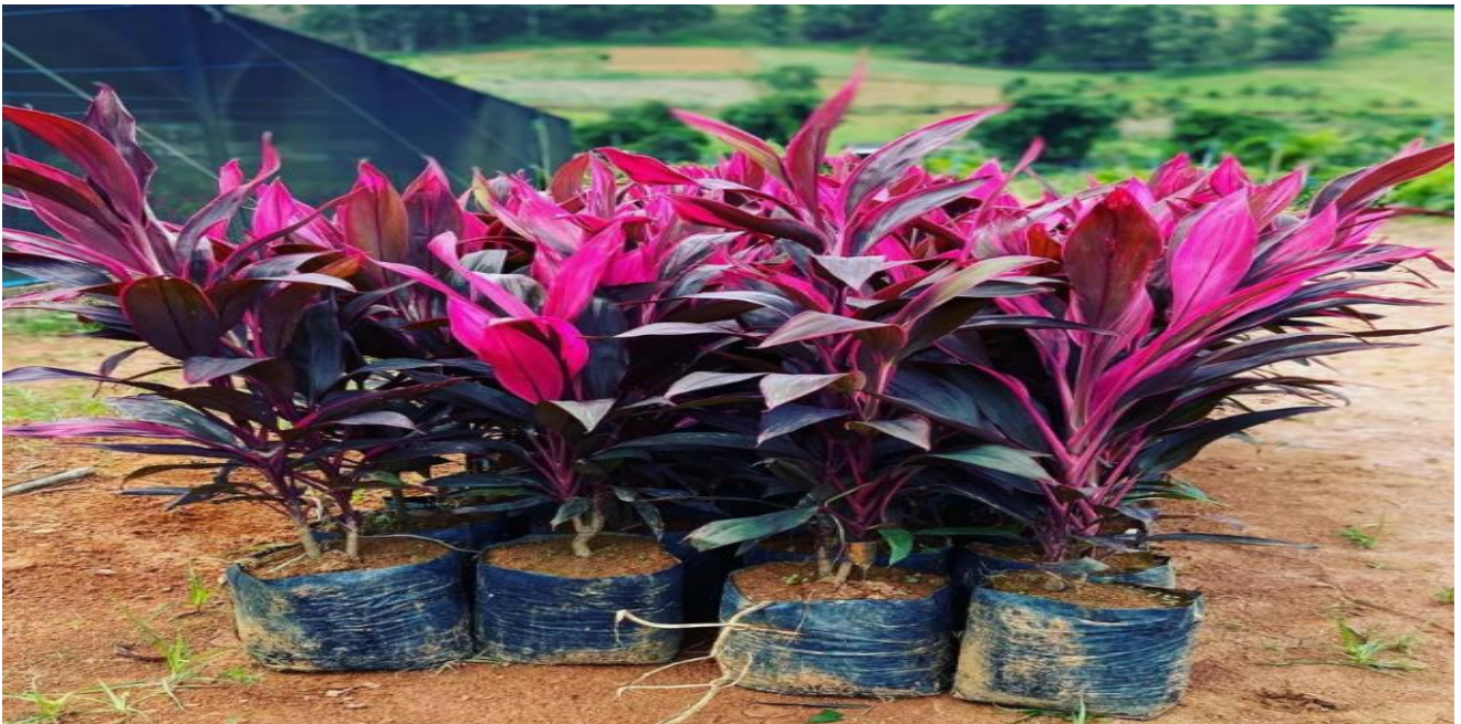
Figura 9: Planta “Dracena Cordyline”.

Serão plantadas 28 mudas da planta denominada Dracena Cordyline (imagem 9) na área delimitada.