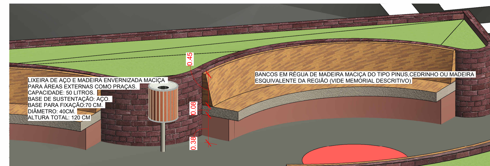
4 Isométrico Banco